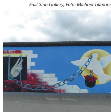
East Side Gallery

Es gibt für die Menschen unterschiedlicher Religionen und Konfessionen Orte, die ihnen heilig oder zumindest sehr wichtig sind. Und es ist der Wunsch vieler, diese Orte aufzusuchen. Orte, von denen viele glauben, dass sie dort Gott ein wenig näher sein können. Dafür nehmen manche sehr lange und beschwerliche Reisen auf sich. Dabei gibt es einen Ort der Gottesnähe, der jeder und jedem ganz nahe ist: Das Reich Gottes. Es ist in dir selbst!